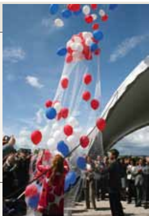
Kronprins Frederik ved åbningen af udstillingen i fjor – den trak 600.000 gæster på tre uger.

At have innovation som en del af sin strategi gennem flere år giver bonus, viser erfaringerne i Horsens. På hospitalet hersker en kultur, hvor alle tænker ud af boksen og har fokus på både små fornyelser i dagligdagen og store forandringer, som tilsammen højner effektivitet og kvalitet. Til gavn for både patienter og personale.